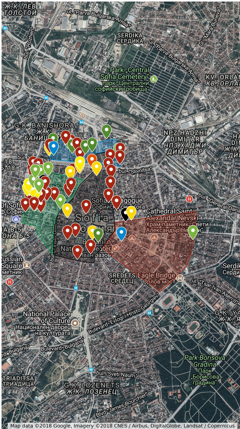
Обр. 2. Карта на ИАР „Сердика-Средец“ (Google Maps Recourse)