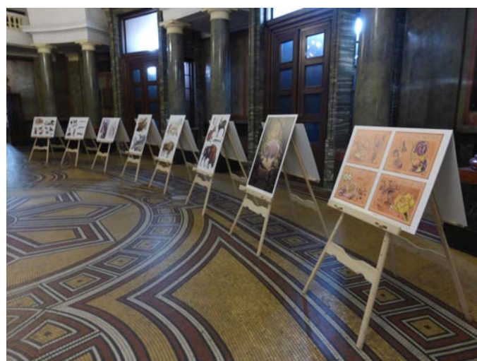
Обр. 25. Изложба „Голямото завръщане“ в СУ „Св. Климент Охридски“, 2015 г.

викателството да направят трейлъра на сериала, с който „Златната ябълка“ придобива популярност, като заявка за един по-голям проект. През 2016 г.