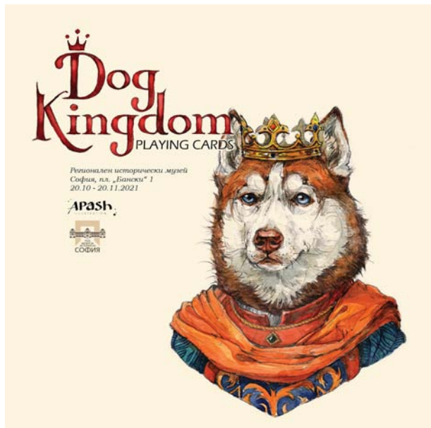
Обр. 46. Плакат на изложбата „Dog Kingdom“.

На 20 октомври 2021 г. в още една от залите за временни експозиции на РИМ–София се открива изложбата „Dog Kingdom“. Младата художничка представя свой авторски проект за луксозно тестве карти за игра, изрисувани с елегантни птици и кралски кучета.