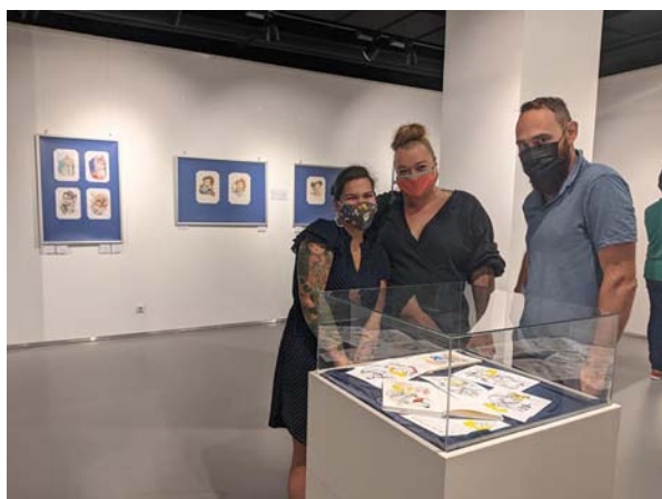
Обр. 29. Откриване на изложбата „Петте пътя на Петя“.

Между 26 и 30 октомври тази изложбена зала е сред местата, избрани