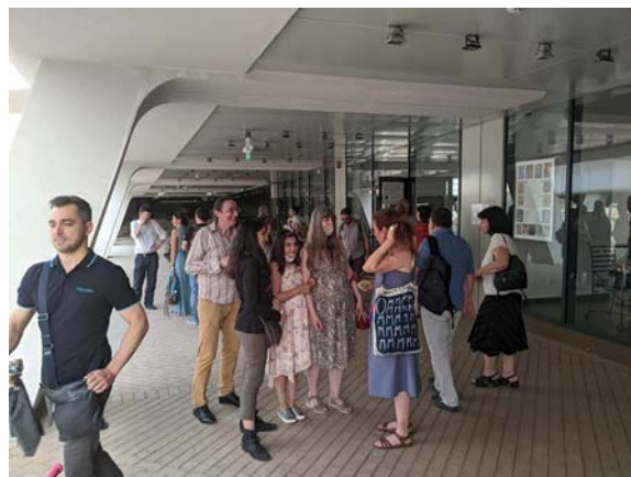
Обр. 1–3. Откриване на изложбата „Детски щрихи“.