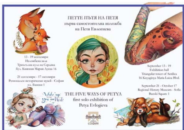
Обр. 21. Плакат на изложбата „Петте пътя на Петя“.