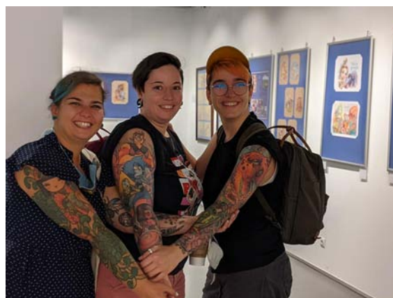
Обр. 22. Откриване на изложбата „Петте пътя на Петя“ в изложбена зала „Триъгълна кула на Сердика“.