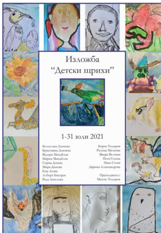
Обр. 6. Плакат на изложбата „Детски щрихи“.

През октомври 2021 г. в или АККК „Сердика“ е представена и изложбата „Спрялото време“ на Христо Христов, подготвена по случай неговата 60-годишнина.