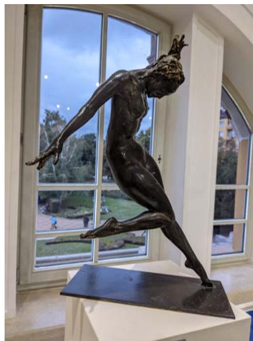
Обр. 45. Никола Колев, „Женска фигура“ – бронз, 2016 г.