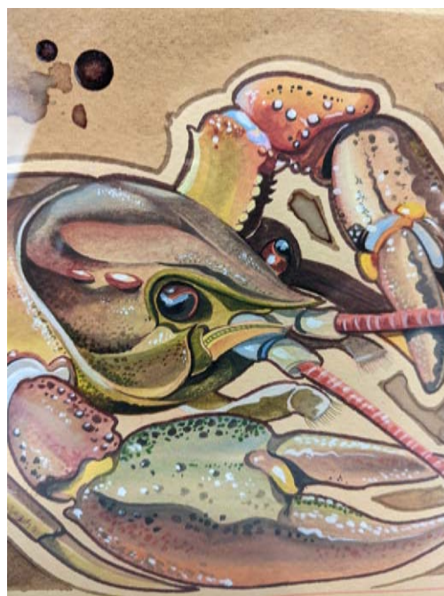
Обр. 26. Петя Евлогиева, „Astacus astacus“ – смесена техника, 2015 г.