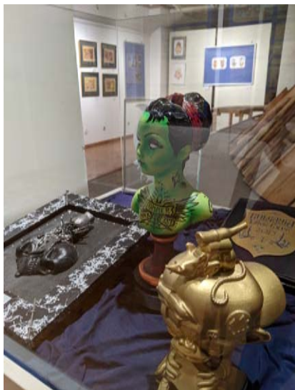
Обр. 23. Избрани награди за татуиране.