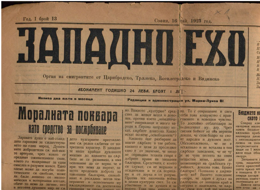
Обр. 4. Вестник „Западно ехо“.