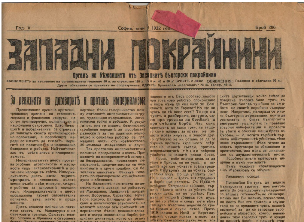
Обр. 5. Вестник „Западни покрайнини“.