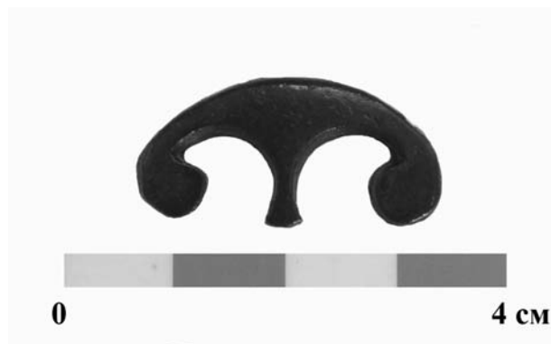
Обр. 1. Бронзово краче с форма на пелта от Сердика, средата – третата четвърт на I век.