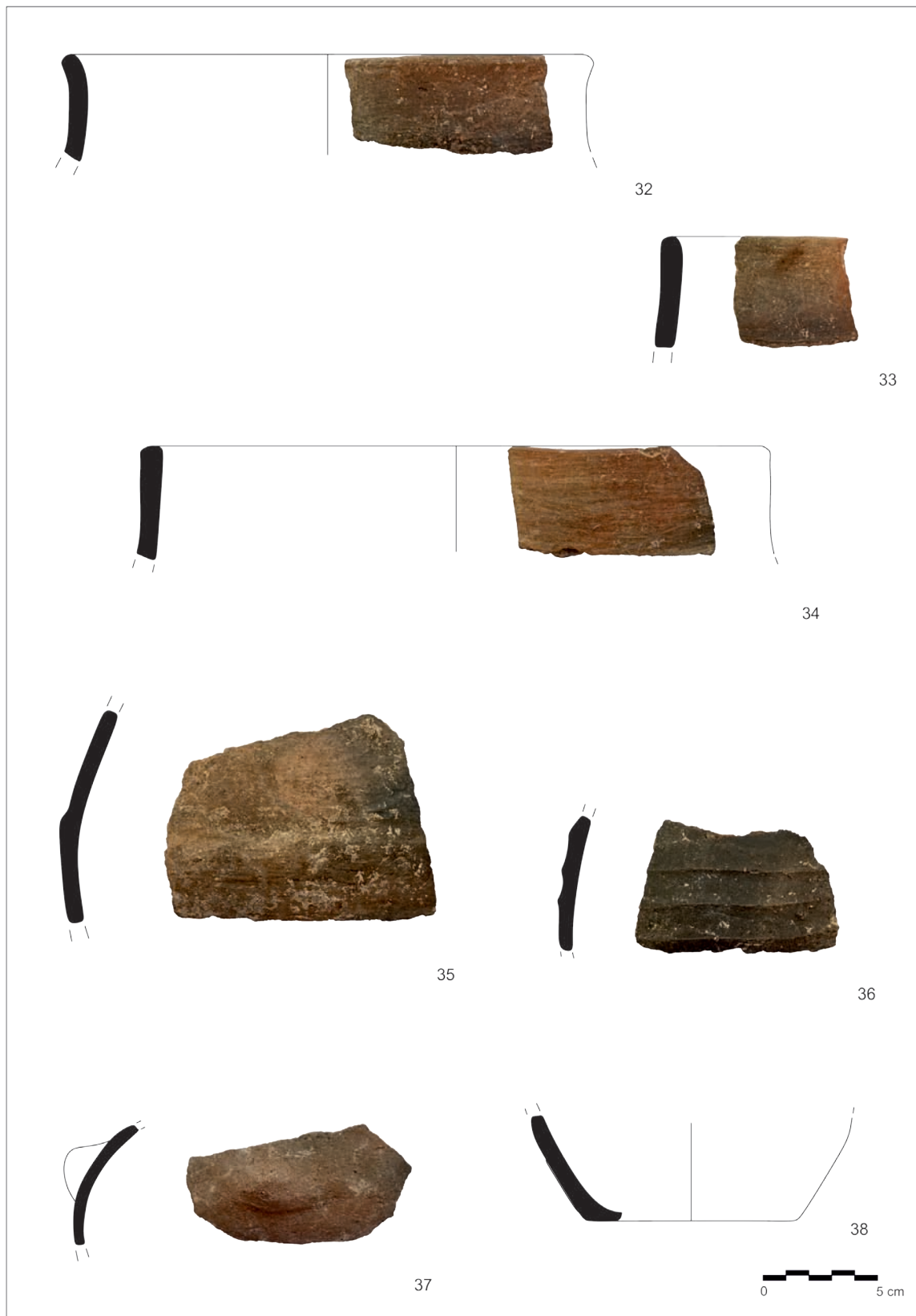
Обр. 4. Дълбоки съдове: 32–38. Гърнета (снимка и графично представяне: М. Попова).