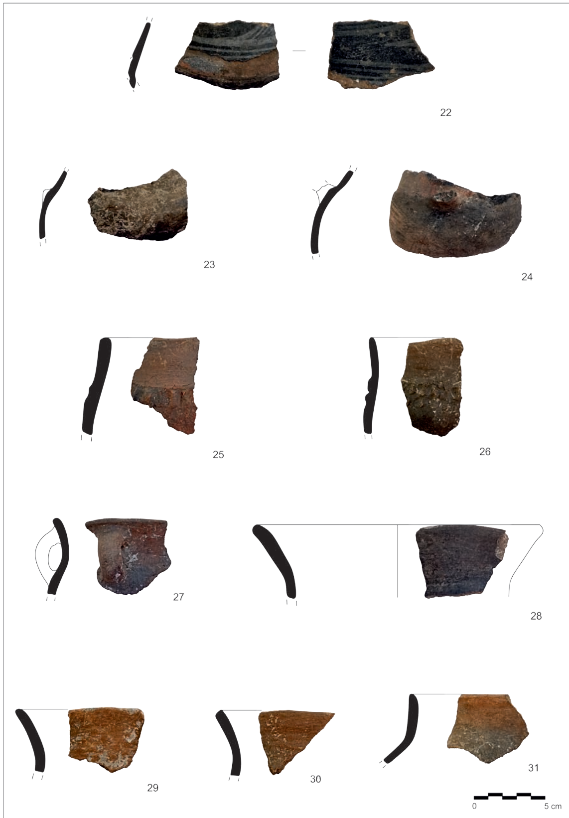
Обр. 3. Дълбоки съдове: 22–24. Купи и гърнета; Дълбоки съдове: 25–31. Гърнета (снимка и графично представяне: М. Попова).