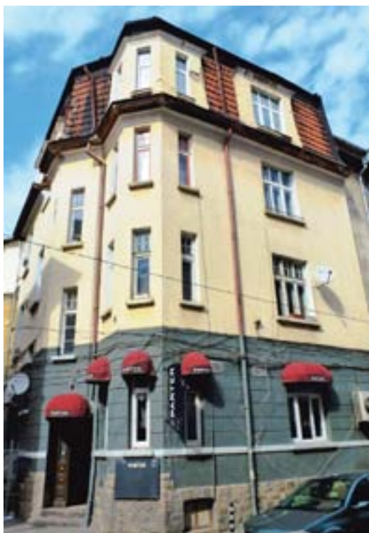
Обр. 5. Ситуация на застрояването по ул. „Добруджа“

За сградата на ул. „Добруджа“ № 9 можем със сигурност да кажем, че това е четириетажна, жилищна кооперация, състояща се от три секции. Тук неизменно отново е налице желанието на автора за създаване на изразителни и разчленени обеми, и той съзнателно използва приложения преди десетина