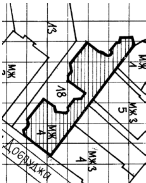
Обр. 4. Ситуация на застрояването по ул. „Добруджа“

Партерният етаж във всяка секция по първоначалната планова схема има връзка с втора, вита стълба, със самостоятелен изход към тогава озеленения двор. Жилищната сграда в интериора е била много богата на архитектурно-художествен синтез, проектиран най-вероятно от самия автор. За съжаление някои от тези елементи вече не съществуват. Във всяко жилище е имало високи кахлени печки, които сега са запазени единично. Интерес за бъдещо проучване представляват и декоративните метални решетки по парапети на стълбища и балкони, които са решени в духа на общия архитектурен стил. Запазена е подовата мозайки при входовете на всяка секция. На места съществуващата оригинална дървена дограма по прозорци може да послужи като образец за подмяна при една бъдеща реставрация. Подобен паметник на културата като пример на важен етап в жилищното строителство у нас си заслужава да бъде подробно проучен и реставриран по първоначалния проект на арх. Койчев както по фасадите, така и в интериора. Разбира се, с оглед на собствеността сега, подобна идея граничи с утопията, но не пречи да мечтаем.