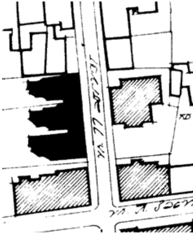
Обр. 2. Ситуация на застрояването по ул. „11 август“

лянов 3 . Новото е, че на този проект може да се погледне като на прототип на секционното жилищно строителство. По това време в София все още няма жилищни кооперации. В историята на архитектурата е прието да се счита, че арх. Лазар Парашкеванов е бащата на кооперативното жилищно строителство у нас. Това е така, той има прекрасни кооперации в София, но построени малко по-късно, към началото на 20-те години на XX в. В случая с трите жилищни сгради на ул. „11 август“ на №№ 5, 7, 9 е налице първият успешен опит да се обединят три секции със самостоятелно развити жилища по етажи. На ниво терен отделните обеми са разположени при свободно застрояване, като всяка една от тях чрез дълъг проход към улицата се свързва с двора. На ниво етаж, обаче сградата е решена като цялостен обем. За съжаление надстрояването над втория етаж през 1958 г. не е съобразено с общото ѝ пространствено въздействие. Търсено е решение за обединяване между етажите чрез еркереите от надстройката с общ балкон, но резултатът никак не е убедителен и е много далеч от прецизния детайл по фасади, създаден от арх. Койчев. Така,